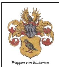
Wappen von Buchenau

Die erste Erwähnung von Buchenau war im Jahre 948. Das Geschlecht derer „von Buchenau“ wurde 1217 erstmalig erwähnt. Da Buchenau zwischen den Klostergrenzen von Bad Hersfeld und Fulda liegt nutzten die Buchenauer diesen Umstand aus, um sich je nach Lage mal auf die eine, mal auf die andere Seite zu wenden. Auch verfeindeten sie sich mit vielen Ihrer Nachbarn, was aus 14 Fehdebriefen aus dem Jahr 1468 hervorgeht. Auch eine Belagerung der Burg ist aus diesem Jahr überliefert welche die Buchenauer erfolgreich abwehren konnten. Es wuchsen so im Laufe der Zeit der Wohlstand und auch die Familiengröße. Gewohnt hat man in der Stammburg an Stelle des heutigen Seckendorffschloss, sowie in dem später errichteten Spiegelschloss. 1550 erbaute Georg von Buchenau mit seiner Frau Susanne von Mansbach das Generalshaus. Nach einem Brand 1520 wurde nacheinander das Spiegelschloss 1572 und das Seckendorffschloss 1578 erbaut. Von 1611 bis 1618 wurde das Schenckschloss erbaut. Nach dem 30jährigen Krieg hatten sich die Machtverhältnisse geändert und so sank die Bedeutung und Reichtum der Familie von Buchenau. 1815 starb die Familie von Buchenau aus. Der letzte Ludwig Karl von Buchenau erschoss sich aus Liebeskummer wegen eines bürgerlichen Mädchens. ☞