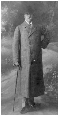
Freiherr Hans Schenck zu Schweinsberg

Buchenau ein und bewohnte Schloss und Obere Burg. Ihr Einkommen bezog die Familie aus dem Waldbesitz, welcher zu dem Schloss gehörte. Später kam noch eine Ziegelei hinzu. ☞